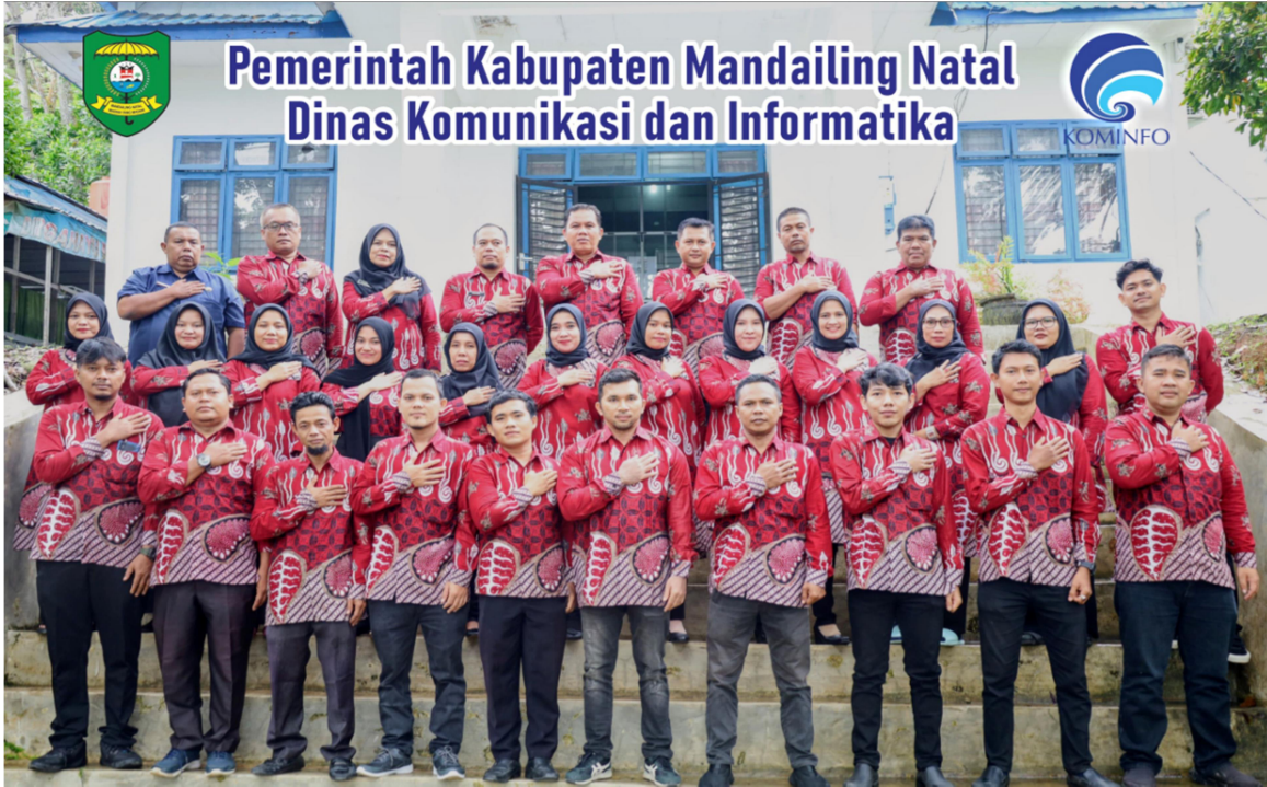
PEGAWAI DINAS KOMUNIKASI DAN INFORMATIKA KABUPATEN MANDAILING NATAL