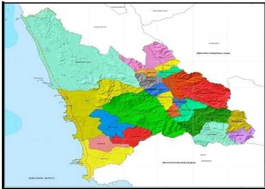
Gambar 1 Peta Wilayah Administrasi Kabupaten Mandailing Natal